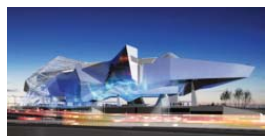
Musée des confluences à Lyon. Coop Himmelblau architectes