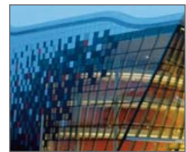
Centre des Congrès de Cracovie.